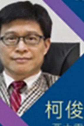
柯俊宏 教授 亞太雷射醫學會 執行長